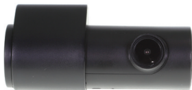
Gator Dash Cam