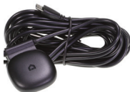
Cavo di alimentazione GPS Dash Cam